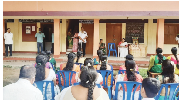
ಅಭಿನವ ಭಾರತಿ ಪ್ರಾಥಮಿಕ ಮತ್ತು ಪ್ರೌಢಶಾಲೆ, ಮಂಡ್ಯ.