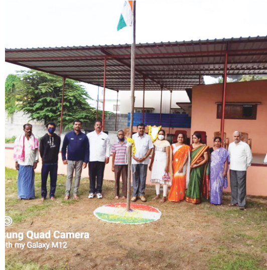
ಅಭಿನವ ಭಾರತಿ ಪಿ.ಯು. ಮತ್ತು ಫಾರ್ಮಸಿ ಕಾಲೇಜು